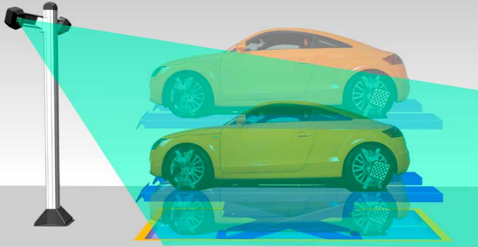
Standardavstånd 2 500 mm - 3 500 mm