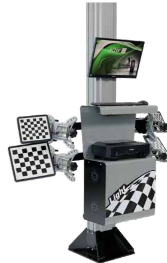
Två olika typer av kabinett att välja på.